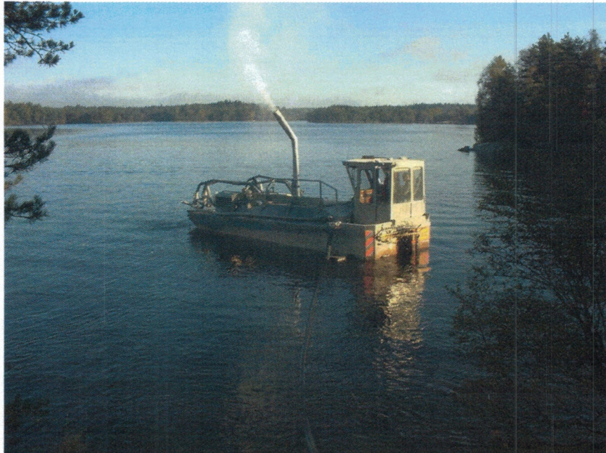
Kalkning av Mollsjön